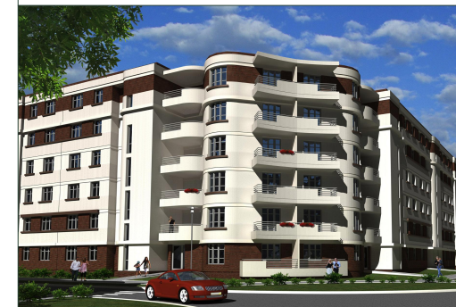
ZESPÓŁ BUDYNKÓW MIESZKALNYCH WIELORODZINNYCH Z GARAJAMI